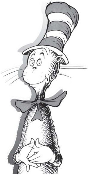
The Cat in the Hat, by Dr. Seuss Published by Random House